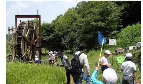
自然観察のようす