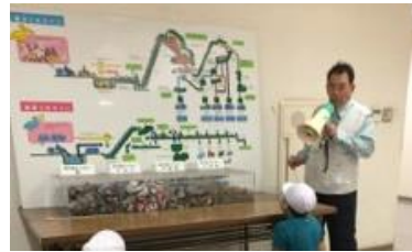
ごみクレーンに歓声をあげる子ども達

私たちの活動の場は、宇部市環境保全センターで、「ごみ処理施設」と「リサイクルプラザ」のガイドをしています。見学者数によって2～5人で担当します。年間2,000人が見学に来られます。特に小学4年生は市内の全校から来られるので責任は大きいです。その他環衛連、市外からの視察、最近では幼稚園児などにガイドしたり、海外からの研修員に説明をすることもあります。