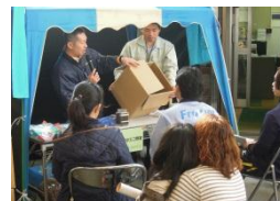
まちなかエコ教室