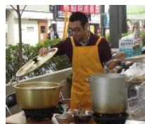
学生さんたちも大活躍