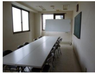
ミーティングルーム小 ～12人程度