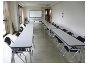
ミーティングルーム大 ～30人程度