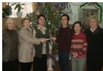
ウクライナのチェルノブイリ被曝者互助団体「ゼムリヤキ」

平和を願う草の根グループ「えんどうまめ」はチェルノブイリ原発事故の半年前の1985年に結成し、28年目になります。チェルノブイリ被曝者支援と平和な社会のための学び合いと支え合いの活動を続けています。メンバーは各自、