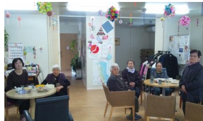
南相馬市の仮設住宅のサロン「真こころ」

平和を願う草の根グループ「えんどうまめ」はチェルノブイリ原発事故の半年前の1985年に結成し、28年目になります。チェルノブイリ被曝者支援と平和な社会のための学び合いと支え合いの活動を続けています。メンバーは各自、