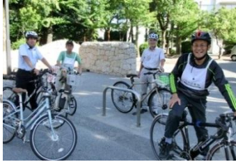
朝サイクリング風景