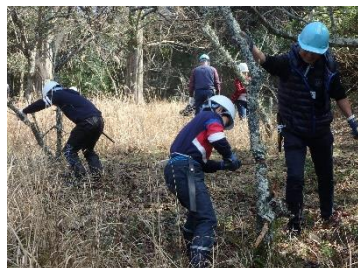
森林体験学習（二俣瀬小学校）

このほかにも、地域イベントでの木工体験指導や高校生へのインターシップの受け入れなども行っています。森林作業体験を通じて、森林の大切さや木材の良さについて理解を深めてもらうとともに、都市部の住民の方にも森林を身近に感じ、森林・林業分野への関心が少しでも高まっていけばと思っています。