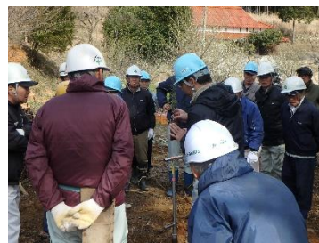
育林についての研修会

ごはんにはたけのご飯を試食したりと、子供たちや保護者に大好評なイベントです。また、市内の小学校で森林整備体験や地域の木材を使った木工体験などを行う「森林体験学習」も主催し、子どもたちに山の恵みを体感してもらえる貴重で楽しいイベントとなっています。