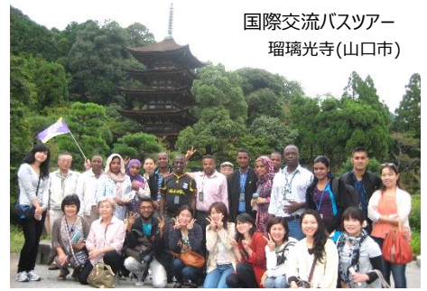
国際交流バスツアー 瑠璃光寺(山口市)

最後に、宇部に來られた研修員の感想を少しご紹介します。「人々は温かく迎えてくれ親切で友好的であった。ボランティアは日本文化を紹介してくれ、宇部市を案内してくれた。そして自分の国にも大変興味を持って尋ねてくれた。大変興味深い経験であり