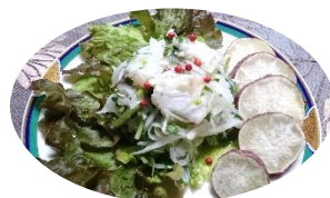
中南米の料理 セビチェ