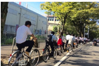
大阪府立吹田東高等学校

講師紹介 ：大阪市自転車通行環境整備に関する検討会議委員をはじめ、自治体の自転車関連委員を務める。また、市民、学生、子供など、年齢層に応じた自転車交通安全教育プログラムの開発と講師を務め、警察との連携による自転車交通安全教室も継続して行っている。今年で第11回となる大阪中之島での御堂筋サイクルピクニックを主催、多くのボランティアと共に大阪の自転車安全啓発イベントとして定着させた。所属するNPO自転車活用推進研究会では理事として関西地区で多くの勉強会を開催するなど、交通安全教育を観点に、適切な自転車利用を推進している。