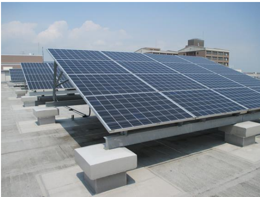
山口大学工学部の太陽光発電などの 再生可能エネルギーを活用した施設 を見学します

宇部市民の皆様を対象とした地域エネルギー教室の参加者を募集しています。 電力の自由化で、どこからでも電気を買うことができるようになります。あなたはどうしますか？ 家族で、お友達と、もちろんお一人でもどうぞ。楽しくためになる教室です。